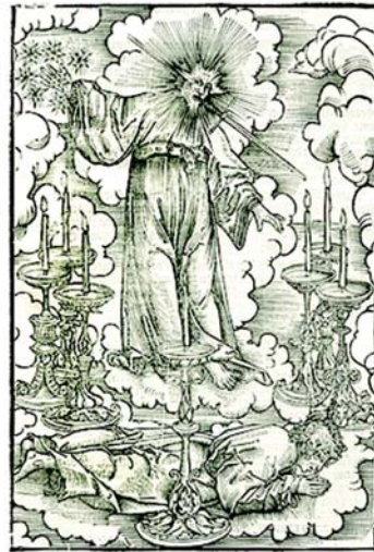
A képeken: (Albrecht Dürer) János apostol látomása (Lucas Cranach)